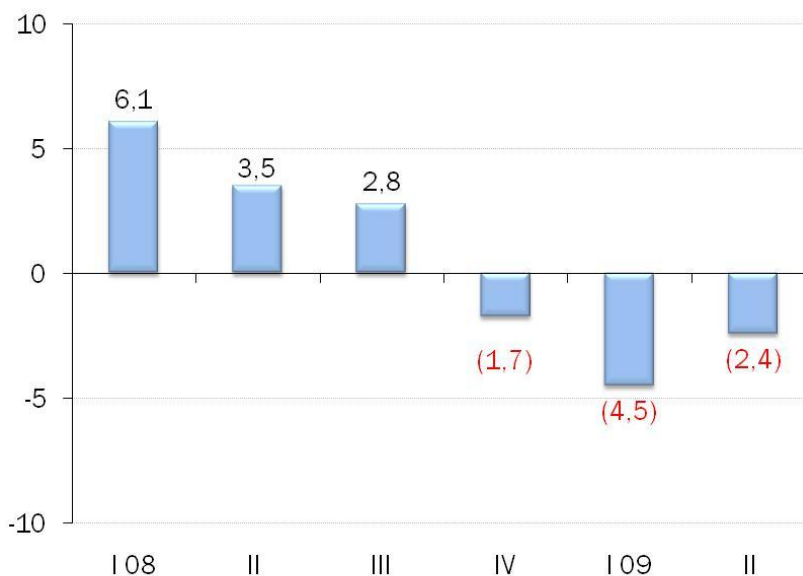
Gráfico No.1 Producto Interno Bruto Trimestral Real -Tasa de variación interanual -