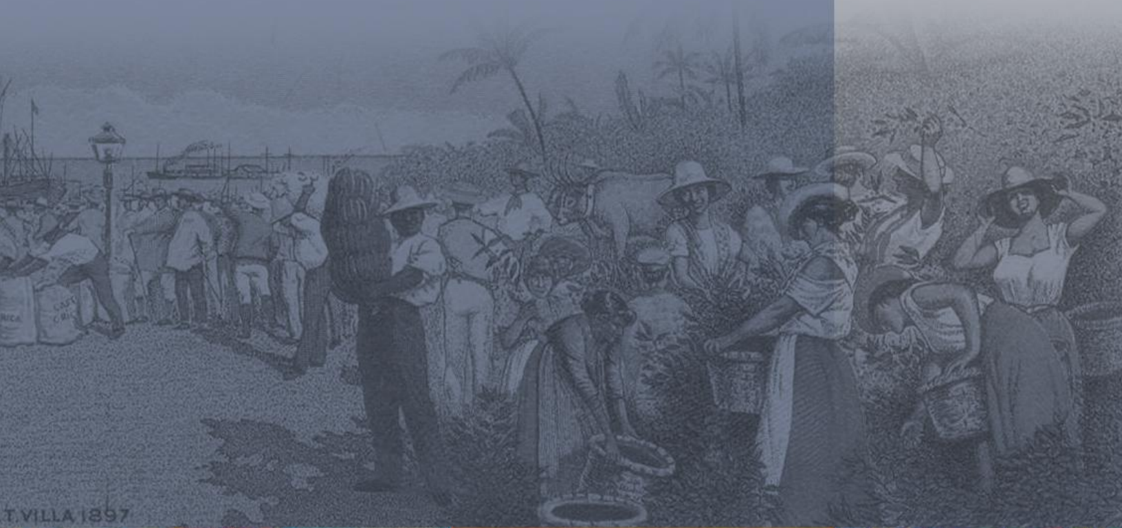
T. VILLA 1897